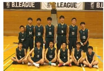
U15 friendly game 優勝写真