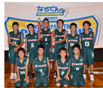
U12 関西バスケットボールスクール CUP 優勝写真